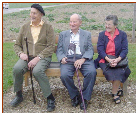
A l'heure de l'apéro, les seniors de Villarzel apprécient le banc devant la grande salle.

Pour la première fois, la traditionnelle rencontre de la Rue du Bourg s'est déroulée... à la grande salle ! Temps incertain et confort obligeant. L'ambiance n'en fut pas moins sympathique et conviviale, le repas délicieux, agrémenté d'une petite salade et des desserts « maison » qui à eux seuls valent le déplacement !