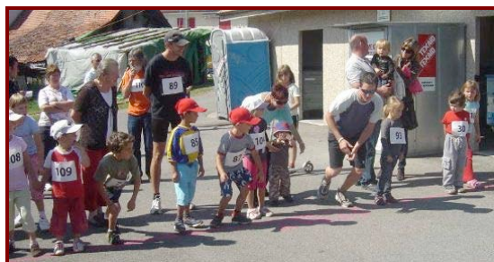
Les petits prêts au départ... avec papa ou maman !