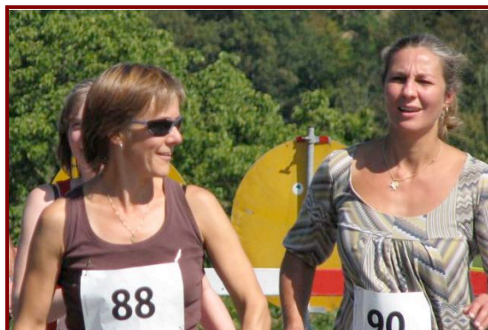
L'effort est violent...