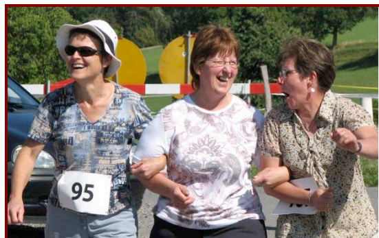
... mais en vaut la peine !

Les gourmands, les sportifs, les fêtards, les anciens et les nouveaux habitants, tous y ont trouvé leur compte !