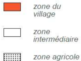
Extrait du plan général d'affectation de Rossens