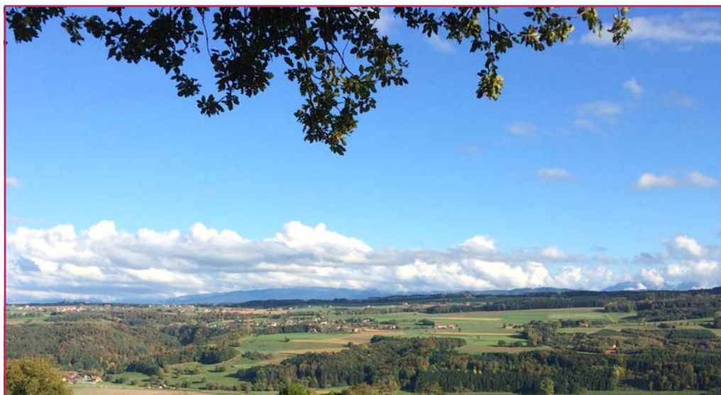
Nos trois villages vus des hauts de Surpierre