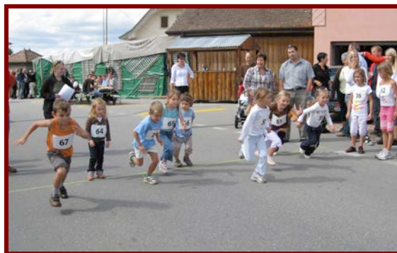
On ne sait pas si la joie des petits est plus grande au départ...

Pour la 4 ème année consécutive, la Jeunesse de Villarzel a animé le village en organisant la fête à Villarzel. Le cross a particulièrement été un succès, puisque plus de cinquante participants de différentes catégories ont pris le départ.